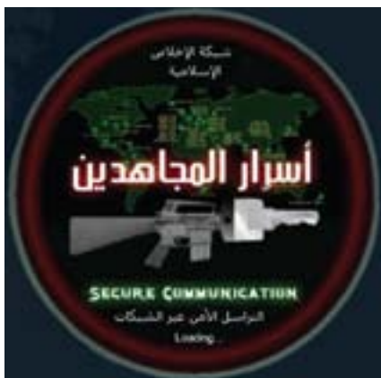
Deze afbeelding benadrukt het gebruik van encryptie voor een veilige onderlinge communicatie.

De globalisering en professionalisering van de virtuele jihad hebben de werking van het jihadistisch internet dus versterkt. Hierdoor heeft het jihadistisch internet kunnen uitgroeien tot de kraamkamer van nieuwe jihadistische netwerken en individuele jihadisten. De AIVD constateert dat jihadistische organisaties als Al Qaida gebruikmaken van en putten uit deze virtuele poel van nieuwe jihadisten. Hiermee vormt het jihadistisch internet een (potentiële) reddingsboei voor deze organisaties, waarvan de fysieke speelruimte in de laatste tien jaar sterk is beperkt.