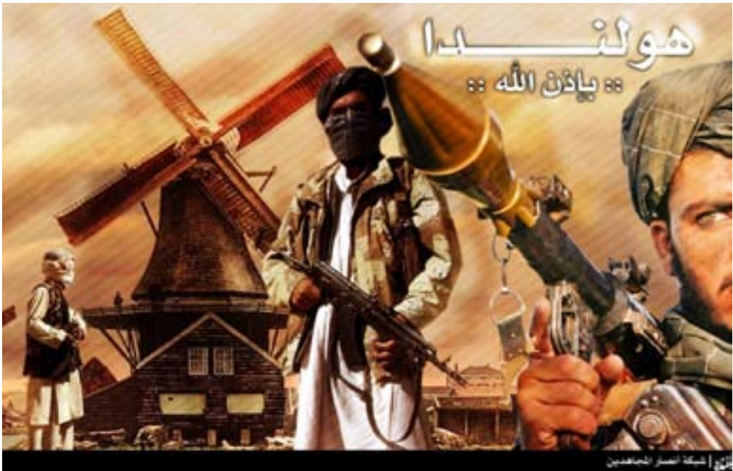
Deze illustratie werd via een kernforum verspreid. Hij verkondigt beeldend de boodschap dat het uitoefenen van de jihad in Nederland de toestemming heeft van Allah.