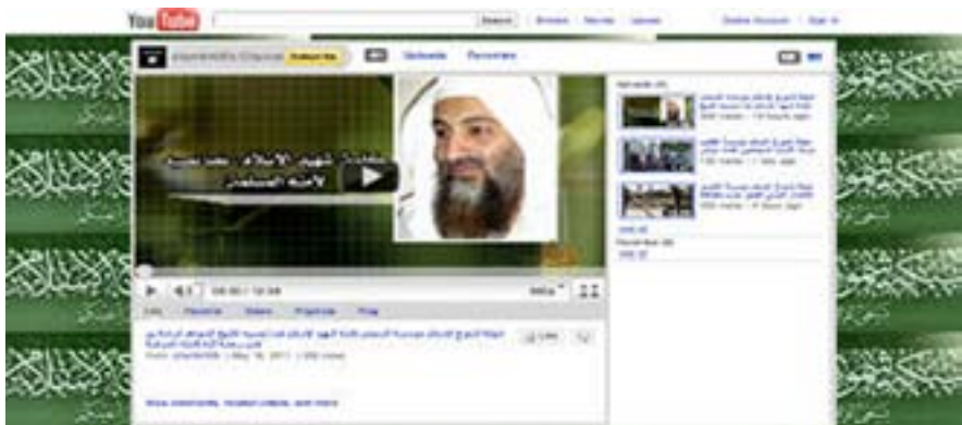
Een voorbeeld van een YouTube-kanaal waarop jihadistische propaganda wordt geherpubliceerd.

Een forumlid waarschuwt hiervoor tijdens een discussie over het gebruik van 'JewTube', hiermee refererend aan de joodse achtergrond van een van de oprichters van YouTube. Deze discussie werd overgenomen door de SITE Intelligence Group, een commerciële Amerikaanse denktank die radicale uitingen op het internet analyseert. Dit forumlid stelt: "Your talk on youtube can be monitored by the Kuffar. Many a brother were arrested based on intelligence from YouTube, they will not hesitate to handover your IP details to Kuffar. Therefore, it is NOT the place you should be social networking." 3 Ten slotte speelt mee dat op sociale media ongewenste uitingen actief door moderators worden verwijderd. Door deze beperkingen worden sociale media vooral gebruikt voor de (tijdelijke) herpublicatie van jihadistische propaganda.