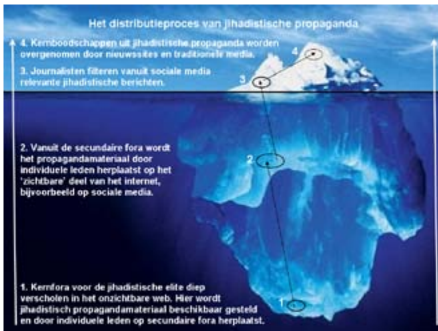
Het distributieproces van jihadistische propaganda van de kernfora via secundaire fora naar het oppervlakteweb.

Secundaire fora spelen een belangrijke rol bij de verdere distributie van nieuw jihadistisch propagandamateriaal. Individuele leden van de kernfora plaatsen hier namelijk (weblinks naar) nieuw jihadistisch materiaal. Individuele sympathisanten op deze secundaire fora herdistribueren de propaganda verder naar het zichtbare oppervlakteweb door ze via onder meer sociale media als Facebook en YouTube aan te bieden. Hiermee vervullen deze secundaire fora een brugfunctie tussen de kernfora en het oppervlakteweb.